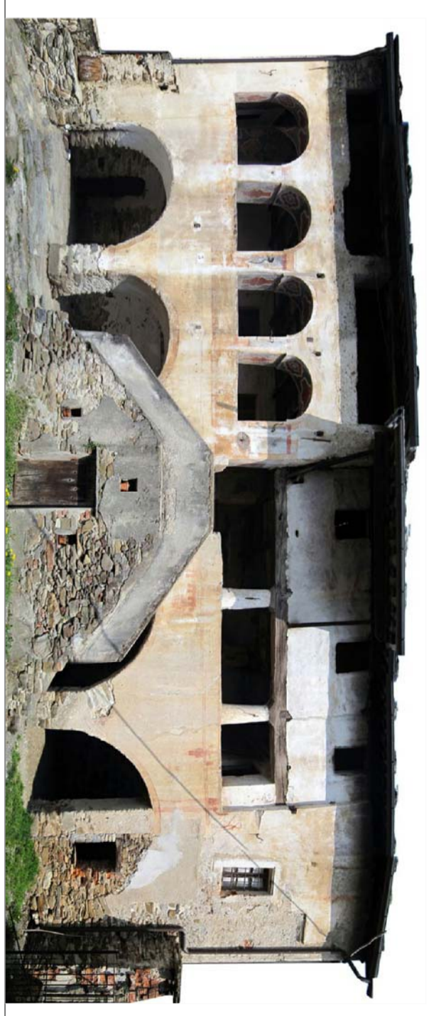
COMUNE DI RIUGLIU Appalto integrato complesso - primo programma 6000, Campasilli - lavori di recupero del fabbricato denominato ka -Dr-sessantè CIG 5204877A79 - CUP E48J15000130001